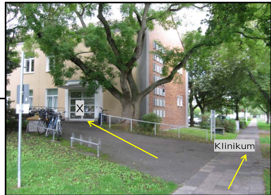
Karte: openstreetmap; Foto: UMG, Institut für Medizinische Informatik